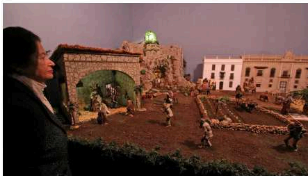
Una mujer admira el montaje del Belén de la Solidaridad.

El Belén de la Solidaridad 2019 es un original Nacimiento de estilo sevillano que instalan personas trasplantadas en el Convento de Santa Rosalía, en pleno centro de Sevilla. Es un belén muy especial porque ya que se representa el Nacimiento entre grandes maquetas de los edificios emblemáticos de Sevilla . Su mensaje es "Un trasplante es otro Nacimiento", para concienciar sobre la importancia de donar órganos.