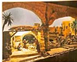
Hospital San Juan de Dios