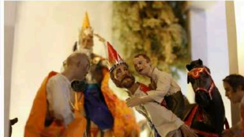
Los Reyes Magos juegan con sus caballos en el Belén inaugurado de Autismo Sevilla en Caixabank.