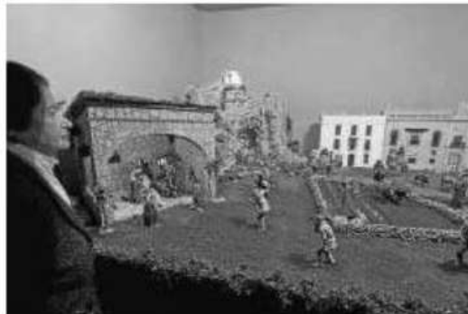
El Belén de la Solidaridad, en una edición pasada.

● Del 8 de diciembre al 5 de enero, el nacimiento del Convento de Santa Rosalía conciencia sobre la donación de órganos